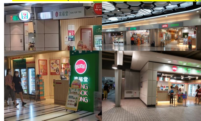
神秘顧客 (18/4 - 3/5, 共8間分店)