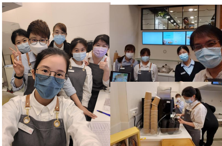
「關鍵時刻」實習店員 (3/5)